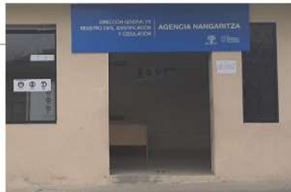
Agencia Guayzimi Calle Loja entre Av. Jorge Mosquera y 26 de Noviembre Teléf.: 3701010 Ext.: 38419