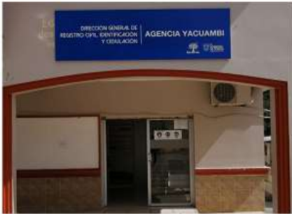
Agencia Yacuambi Calle Miguel Díaz y 10 de marzo Teléf.: 3701010 Ext.: 38412