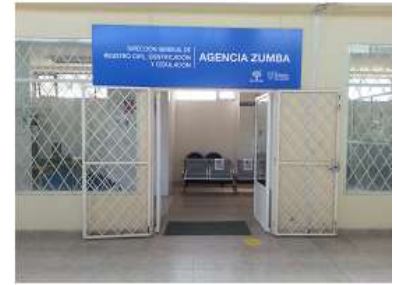
Agencia Chinchipe Av. Jaime Roldos y Manuel Rodríguez Teléf.: 3701010 Ext.: 38410